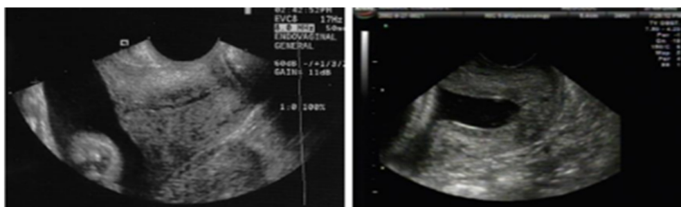
Figura 1. Cervicometría de cuello normal y corto

En el ámbito de la disfunción cervical o incompetencia cervical representa la imposibilidad de un cuello uterino de mantener el embarazo, debido a que se dilata pasivamente (sin mediar contracciones), se presenta el clásico cuadro clínico de los abortos espontáneos del segundo trimestre (cada vez más precoces), donde la paciente consulta por flujo genital o sensación de peso en la pelvis, en consecuencia se produce el aborto (34). También los antecedentes de cirugía cervical, incluyendo conización y procedimiento de escisión electroquirúrgica en asa (LEEP) se han asociado con parto pretérmino derivado de la lesión cervical, aunque, esta relación también puede estar asociada al comportamiento de la embarazada y su pareja o a los factores ambientales. Por otra parte, el fumar es un factor de comportamiento que promueve la progresión de displasia cervical y a su vez es un factor de riesgo para parto pretérmino. En el mismo orden de ideas como factor predictivo está la longitud cervical corta, menor a 25 mm, antes de las 24-28 semanas de gestación, siendo esta proporcional a la longitud cervical, mientras más corta sea esta medida existirá mayor riesgo de parto prematuro, dicha medida es realizada por ultrasonido transvaginal (23, 27). (31) (35)