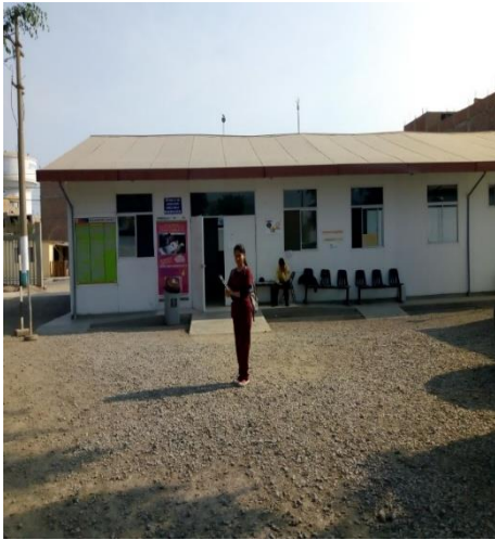
Centro de salud Juan Pablo II