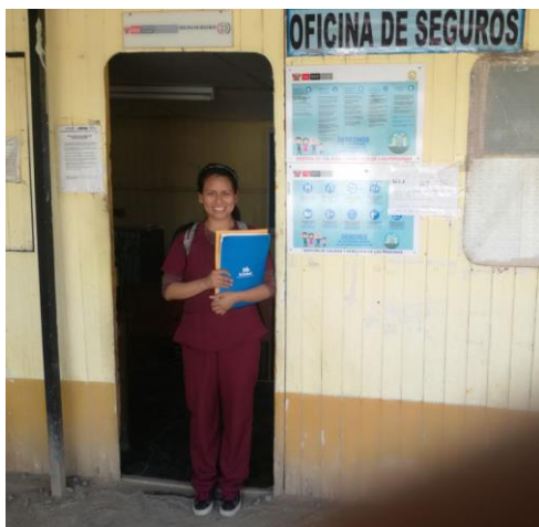
Área de estadística