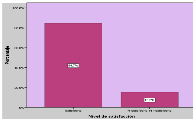
Gráfico N°3: Análisis descriptivo del nivel de satisfacción

Interpretación: Se analiza en la tabla el nivel de satisfacción, teniendo como resultado “Satisfecho” con un 84.7%, “Ni satisfecho, ni insatisfecho” 15.3% y “Insatisfecho” 0.0%.