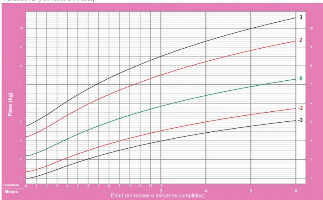
Patrones de crecimiento infantil de la OMS