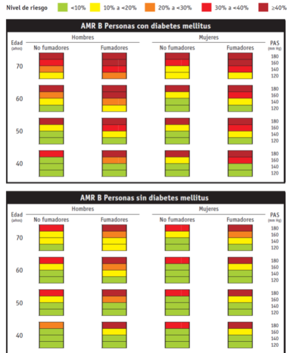
Tabla de predicción de riesgo AMR B de la OMS / ISH para los contextos que no puede medir el colesterol sanguíneo. Esta tabla mide en porcentaje a mayor porcentaje mayor riesgo de padecer un episodio cardiovascular, mortal o no, en un periodo de 10 años, según el sexo, edad, la presión arterial sistólica, el consumo de tabaco y la presencia o ausencia de diabetes mellitus.