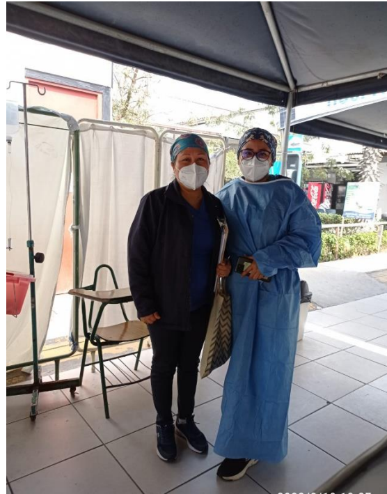
Figura 4. Recolectando datos