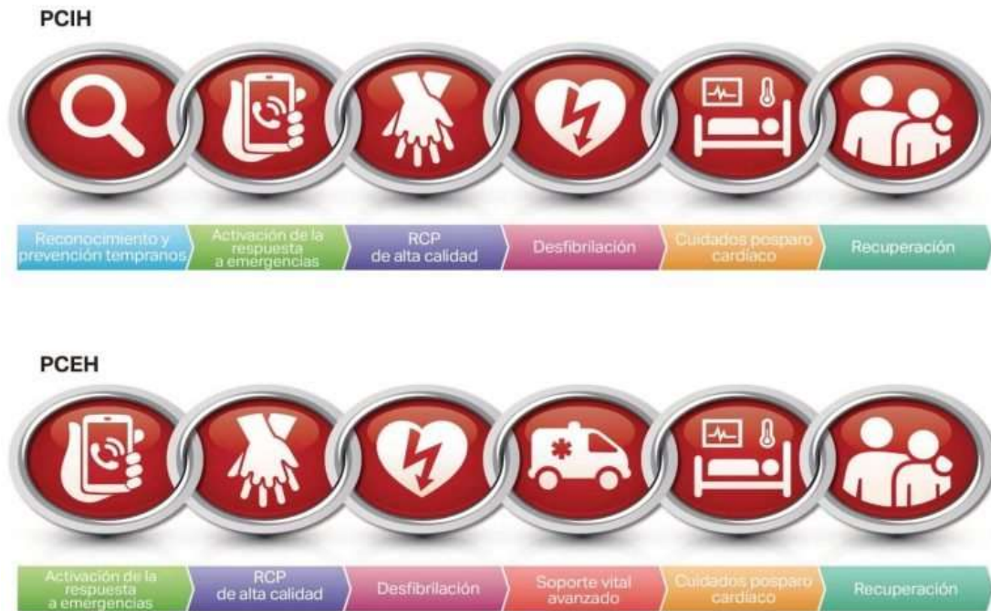
Fig. 1 - Cadenas de supervivencia PCIH – PCEH 2020.