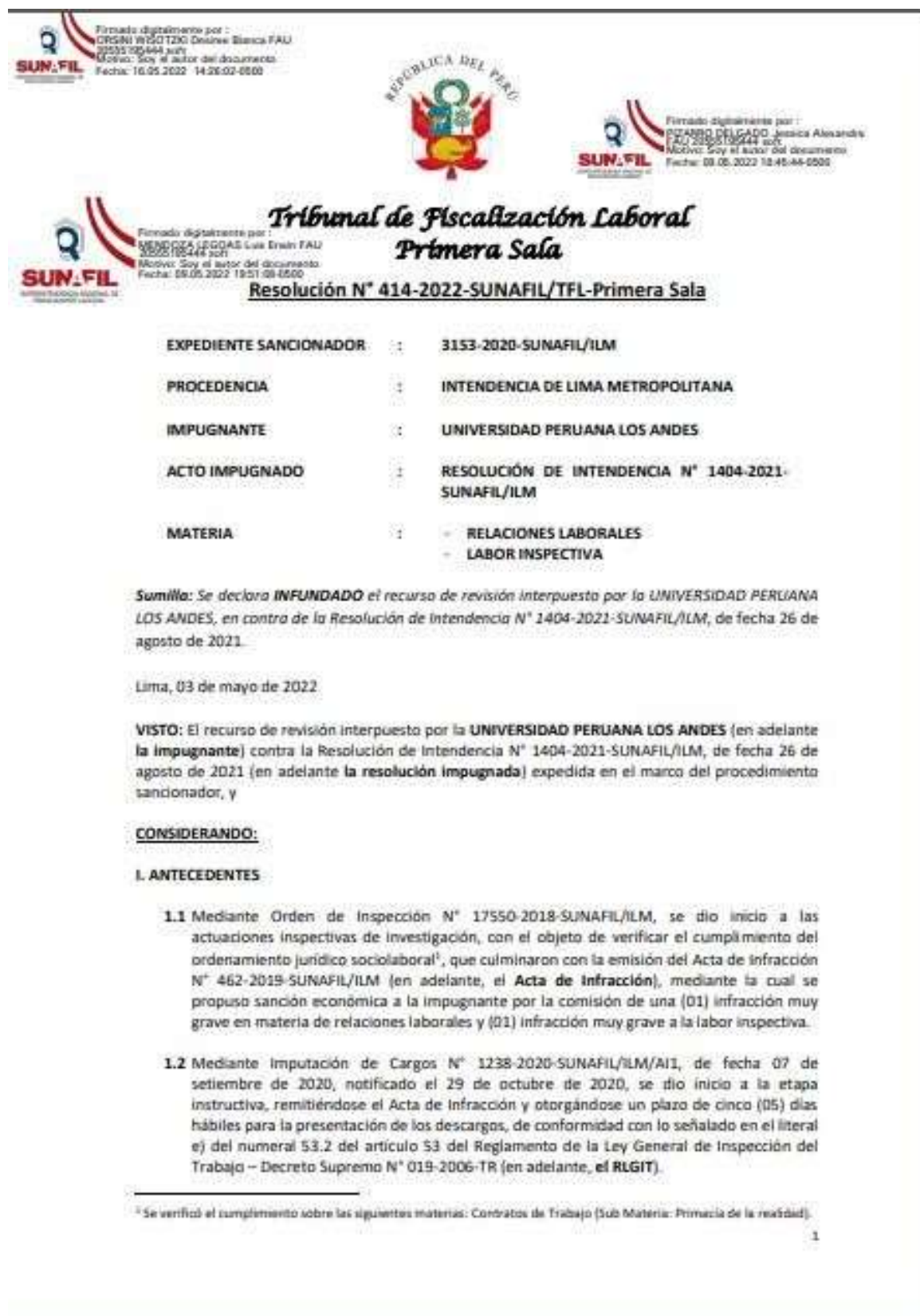
Ilustración 1: Resolución N° 414-2022-SUNAFIL/TFL-Primera Sala