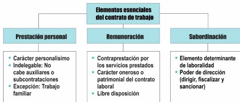
Ilustración 1

1.1.4. Sobre el particular, corresponde señalar que el elemento determinante de una relación laboral es la subordinación, la cual, a criterio personal, puedo afirmar que se demuestra válidamente por el demandante y sobre el cual el Juez especializado se pronuncia a favor. Para mayor ilustración, en el siguiente cuadro, Toyama y Vinatea 2 , desarrollan los elementos esenciales del Contrato de Trabajo: